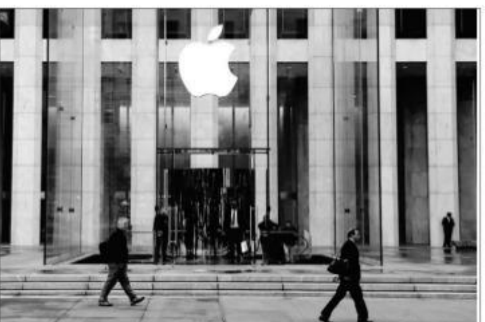
An Apple store in New York

PMC, a licensing firm, had originally sued Apple in 2015 alleging the tech giant's iTunes service infringed seven of its patents. Apple successfully challenged PMC's case at the US patent office, but an appeals court in March last year reversed that decision, paving the way for the trial. The iPhone maker did not immediately respond to Reuters' request for