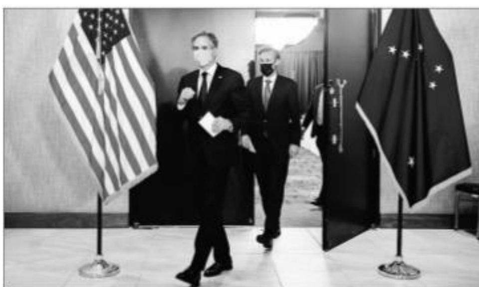
US secretary of state Antony Blinken and national security adviser Jake Sullivan exit the ballroom from the closed-door session of talks between the US and China upon conclusion of their two-day meetings in Anchorage, Alaska, US

TOP US AND Chinese officials wrapped up two days of contentious talks in Alaska on Friday after trading sharp and unusually public barbs over vastly different views of each other and the world in their first face-to-face meeting since President Joe Biden took office.